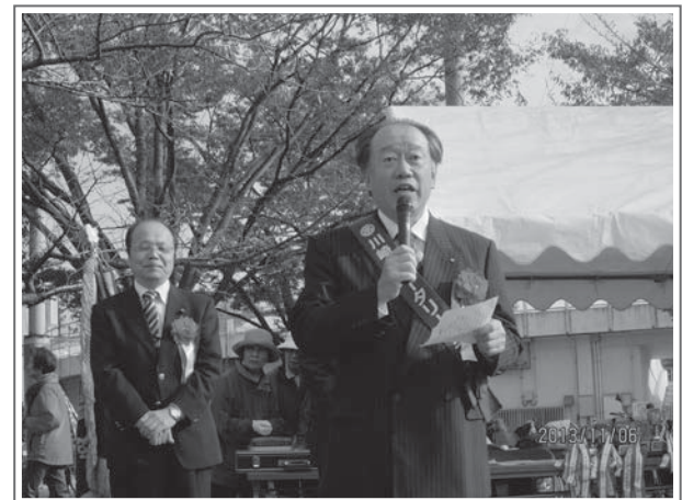
▲ 中原区ゲートボール大会での会長あいさつ