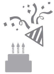
▲ 11月誕生日の方々。お誕生日おめでとうございます。