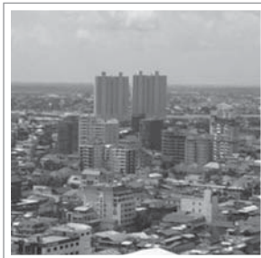
高級住宅街(バンケインコーン地区)