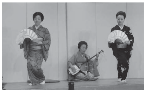
▲ 芸子さんの踊りを楽しませていただきました。