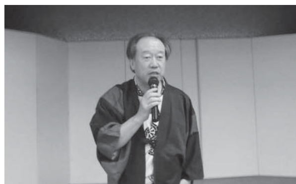
▲ 上原会長による懇親会挨拶を頂きました。