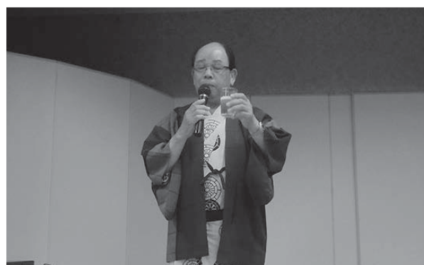
▲ 中山会員による乾杯の音頭を頂きました。