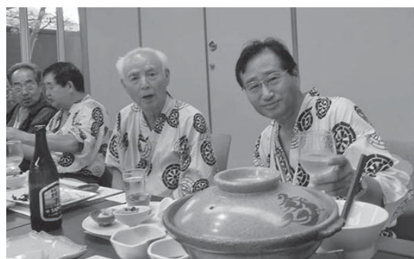
▲ おいしい食事と楽しい懇親会の一コマ。