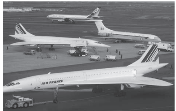
日本で行われたサミットに参加されたとき、フランスの大統領と首相がそれぞれ乗られたコンコルド2機とサッチャー首相の専用機です。