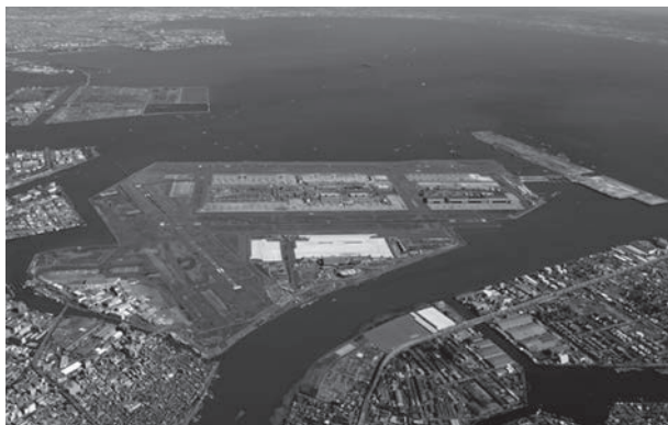
今の羽田空港と川崎工場群と多摩川