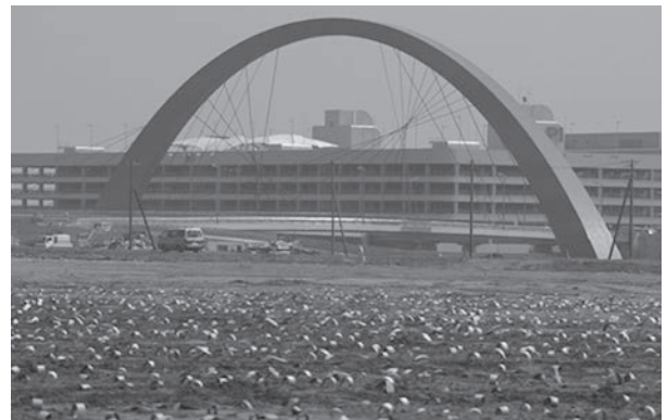
羽田空港の埋め立てには海底のヘドロや残土など水分が多く含まれているため、広い埋立地を1m間隔に深さ30mまでペーパードレーン工法によって水分を吸い上げている。遠く見るとネギ坊主のように見えた。