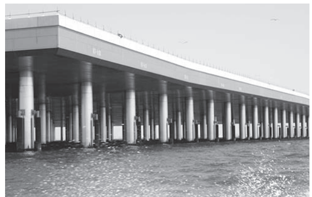
D滑走路の棚橋の部分です。錆びないためにチタン鋼により作られた滑走路は世界でも珍しく、100年間使用に耐えられるように設計されている。水面下の安定地盤まで100mの杭が1,165本で使用鋼材が35万トン。(東京タワー83塔分)