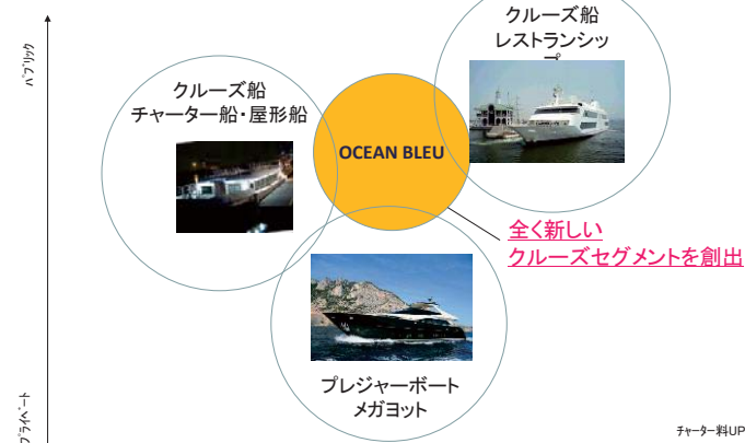
MONACO STYLE CRUISE 32