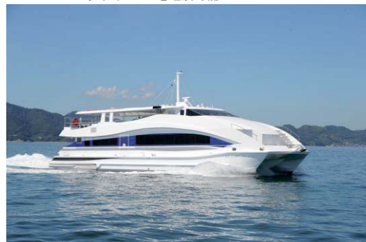
MONACO STYLE CRUISE 29

就航 2012年9月 サイズ 総トン数 98t 全長27.25m 旅客定員144名(3時間未満) 用途 チャーター専用船 多彩なコースを運航可能