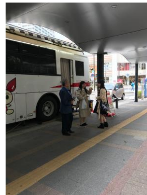
今回は若い方(特に高校生の友達同士) が多くて日赤の職員の方も今後について 明るい状況だと感激しておられました