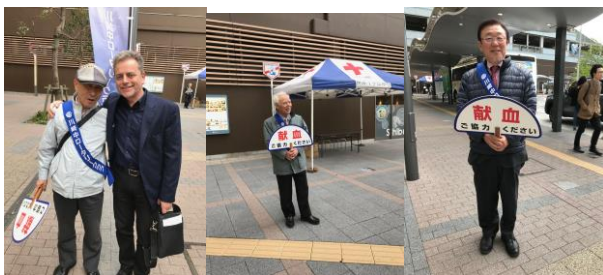
小泉会員が英語の先生との偶然な出会い