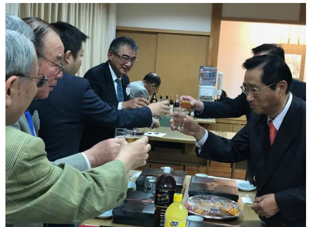
みなさん乾杯 会報委員もこれにて祝杯……