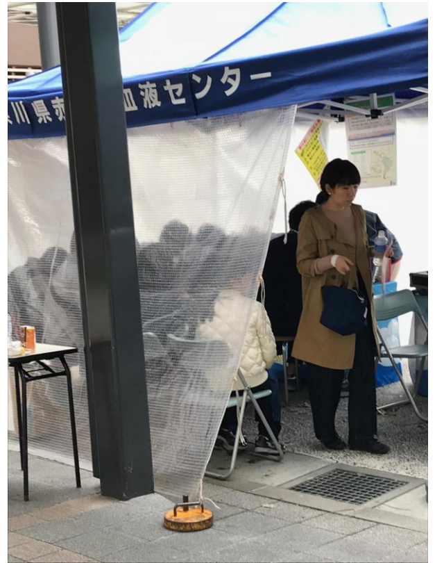
テントの中は献血者で満員状態です