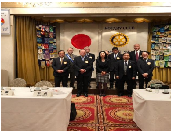
承認された会員の皆様です。