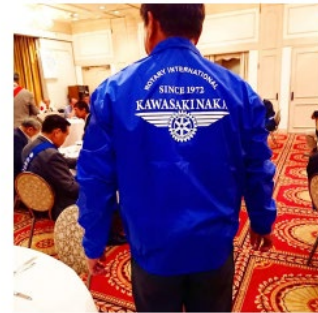
このジャンパー着て奉仕活動アピール しましょう！