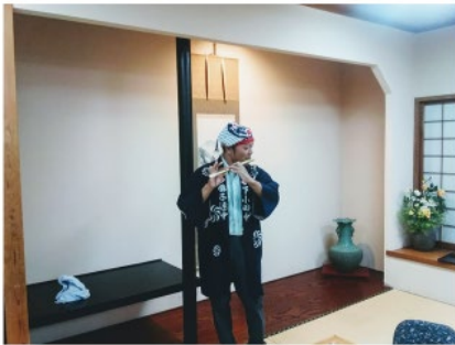
こっちが本職なんですよ！ 大戸神社のお祭り来てね☆