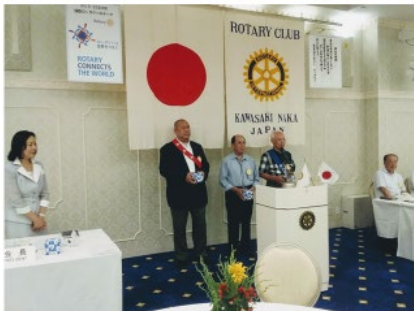
両脇の会長・副会長の笑顔が良い