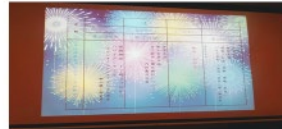
どうでしょう？この3枚の画像