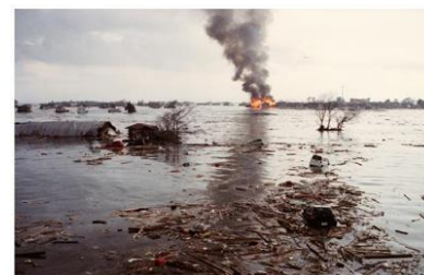
津波直後の閑上中学付近