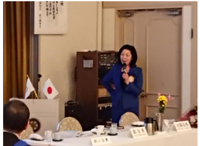
川崎中ロータリークラブ関上小中学校訪問報告 (内容については別紙)