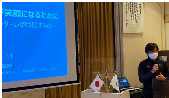
シニアディレクター 長谷川 幸雄様